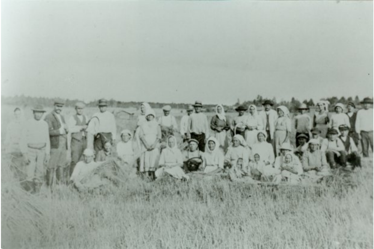
Kuva 1. Kuhmalahden Ison-Pennon Yli-Knaapin elonleikkuväkeä 1900-luvun alkupuolella.”

Heinäkuun lakko jäi ainoaksi lakoksi Kuhmalahdella. Marraskuun yleislakosta ei juuri edes tiedetty ennen kuin se oli jo loppunut. Sen merkitys Kuhmalahden työläisille oli lähinnä mielialaa kohottava. Sosialistilehtien kertomukset saavutetuista voitoista saivat kuitenkin Vehkajärven työväenyhdistyksen järjestämään tämän kunniaksi tanssit.