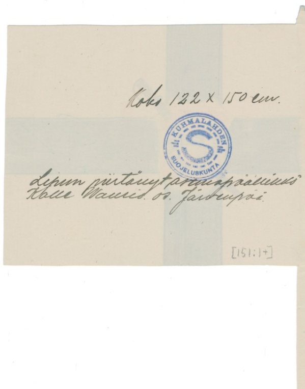
Kuva 3. Kuhmalahden suojeluskunnan lippupiirros. 125